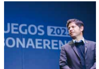
El gobernador Kicillof.

"Hay quienes piensan como Milei, que cada uno tiene resolver lo suyo por su cuenta, desde el individualismo, si tiene la guita que lo haga y es libre, y si no se queda afuera. Si eso fuera cierto podemos tener pibes y pibas muy talentosos, que esperaban participar de los Juegos Evita, antes llegaban 25.000 los inscriptos, hoy 2 de cada 3 no llegan: se quedan sin la