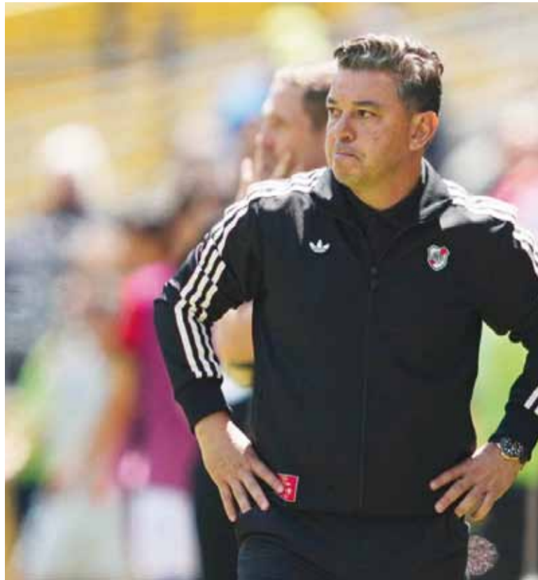
Planificación. El "Muñeco" ya hizo un análisis de los puestos en que necesita cambios.

que, aunque no figura en la lista inicial de posiciones pedidas por Gallardo, despierta interés: el chileno Lucas Cepeda. Extremo que puede jugar por ambos lados, fue ofrecido a River y el DT lo ve con buenos ojos. Tiene contrato en Colo Colo hasta 2026 y una cláusula baja (5 millones de dólares), pero su llegada depende de que se libere un cupo de extranjero, algo que podría resolverse con la salida de Adam Bareiro.