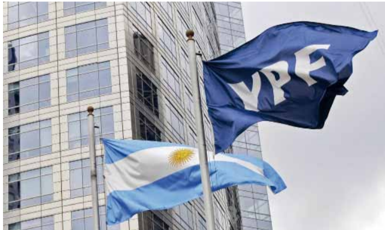
Fallo adverso. La Justicia resolvió sobre el caso YPF.

Tras conocerse la noticia, el presidente Javier Milei apuntó contra el kirchnerismo y el entonces ministro de Economía de 2015, Axel Kicillof, y confirmó la administración libertaria apelará la resolución. "Independientemente de la cuestión de fondo, haber llegado a esta situación del país, es responsabilidad directa del inútil soviético de Axel Kicillof cuando era Ministro de Economía durante la segunda presidencia de la condenada de CFK. Al margen