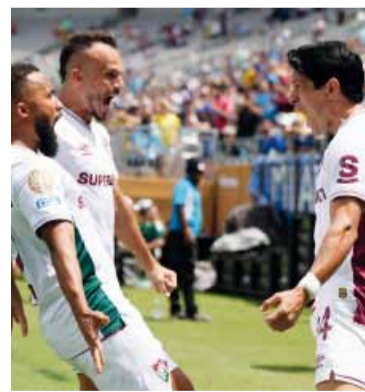
Alegría brasileña. El conjunto carioca festeja una victoria histórica.

La dirigencia ya tomó nota de los pedidos de Gallardo. El objetivo está claro: armar un equipo competitivo que permita soñar en grande en América. El "Muñeco" quiere reforzar, pero no a cualquier precio: busca nombres que eleven el nivel real del plantel, y sabe que para pelear la Libertadores hacen falta algo más que intenciones.