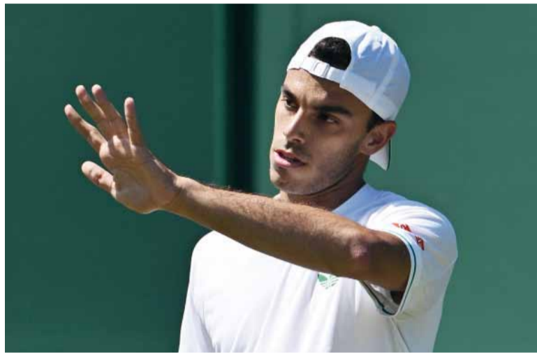
Decepción. El tenista bonaerense arrancó bien pero luego se derrumbó y se despidió del torneo.