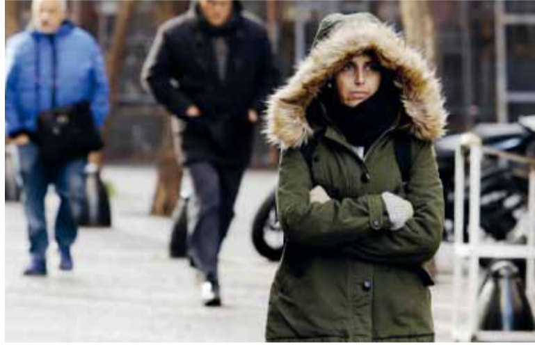
Alerta frío. Serán unos días de mucho abrigo en el país. - NA -

El resto de la Argentina quedó bajo alerta amarilla, y en algunos puntos el SMN se elevó el nivel a naranja incluyendo parte de Neuquén, Mendoza, San Luis y Córdoba y el noreste de Chubut. Esto