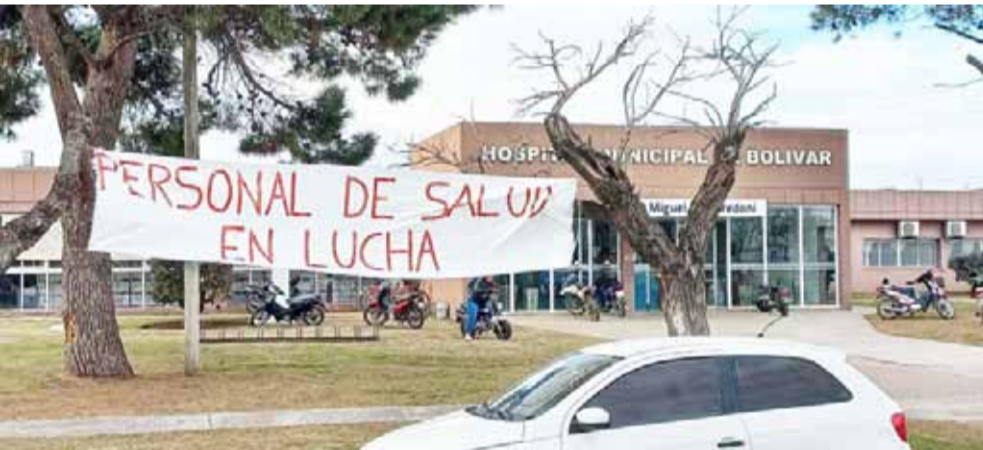
Seguramente volvamos a ver banderas con este tipo de reclamos frente al Hospital “Dr. Miguel L. Capredoni” si el conflicto escala.

Bolívar no ha adherido”. “Como gremio apelamos a la pronta solución de este conflicto salarial con las autoridades municipales y entendiendo la situación compleja que esto acarrea, hemos decidido que las medidas se irán realizando de manera escalonada, pero con la firmeza de avanzar en las mismas si el conflicto no se resuelve”. “Solicitamos la comprensión de toda la población ante esta difícil situación y exhortamos a las autoridades competentes a que den una pronta y efectiva solución al conflicto, evitando así mayores perjuicios para el sistema de salud y la comunidad en general”. “Seguiremos informando sobre el desarrollo de esta situación”.