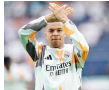
Kylian Mbappé.

Real Madrid se mide ante Juventus y vuelve Mbappé